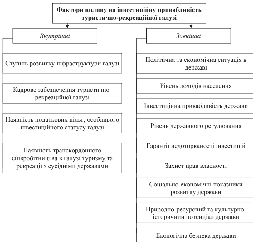
Рис. 1. Фактори, що впливають на інвестиційну привабливість туристично-рекреаційної галузі

Загалом джерела формування інвестиційних ресурсів в туристичній та туристично-рекреаційній галузях є