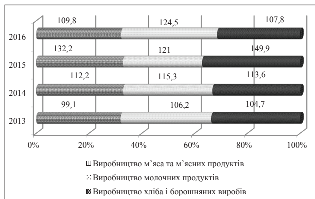
Рис. 3. Індеси цін виробників промислової продукції у виробництві деяких харчових продуктів, %

Зниження попиту, на нашу думку, відбулося: по-перше, внаслідок збільшення цін реалізації та зниження купівельної спроможності населення; по-друге, зменшення обсягів експорту. Наприклад, розглянемо «Індекс цін виробників промислової продукції у виробництві харчових продуктів»: виробництво м'яса та м'ясних продуктів, виробництво молочних продуктів, виробництво хліба і борошняних виробів за 2013-2016 рр. (рис.3).