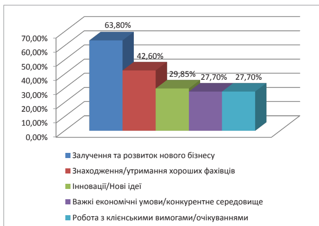
Рис. 2. Топ-5 найважливіших задач ІТ-компанії

Дані результати є особливо показовими порівняно з результатами, отриманими в інших секторах, що надають професійні послуги. Як і для компанії в інших секторах, залучення та розвиток нового бізнесу є головним пріоритетом, і цей показник буде тільки набирати більш важливого значення, оскільки все більше і більше конкурентів увійшли на ринок ІТ-технологій та змагаються за обмежену кількість покупців.