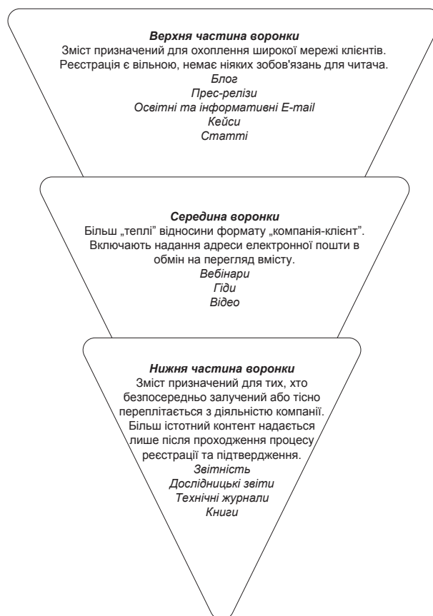
Рис. 3. «Змістова воронка», або виховання цільової аудиторії у сфері ІТ-послуг

Стратегічний прийом змістовного маркетингу знову повертає ІТ-фахівця до важливості знань у сфері освітнього контенту. «Змістова воронка» є ключовим елементом для маркетингу ІТ-послуг, залучаючи відповідні аудиторії і приводячи до розширення бізнесу (рис. 3).