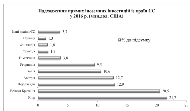
Рис. 3. Обсяги надходження прямих іноземних інвестицій із країн ЄС у 2016 р. [7]

Досліджуючи рівень інвестиційних надходжень із країн ЄС в економіку України, важливим є те, що ці інвестиції становлять приблизно 44,7% від загального обсягу інвестицій за 2016 р., що в реальному відношенні становить 972 млн. дол. США. До найбільших інвесторів Європи незмінно належать Кіпр (427,7 млн. дол.) та Велика Британія (403,9 млн. дол.) (рис. 3) [7].