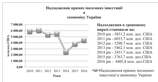
Рис. 1. Обсяги надходження прямих іноземних інвестицій в економіку України [7]

Із даних рис. 1 видно, що протягом 2013–2016 рр. обсяг прямих іноземних інвестицій зменшився на 19,3%, що становить 1 056,3 млн. дол. США, спостерігалися значні коливання іноземного капіталу. Вже в 2015 р. інвестиції надходили зі 133 країн світу і становили 3 763,7 млн. дол. США.