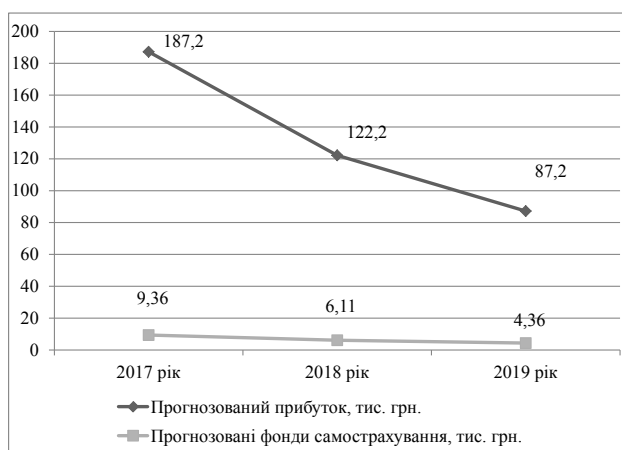
Рис. 1. Прогнозований розмір прибутку та фондів самострахування ДП «Дослідне господарство інституту сільського господарства Північного Сходу НААН України» Сумського району Сумської області в 2017–2019 рр.

Для такого аналізу найчастіше використовують засоби економіко-математичного моделювання та економічного та статистичного аналізу. Найбільш поширеними методами є дисперсійний аналіз, трендовий аналіз, коваріаційний аналіз та кореляційно-регресійний аналіз.