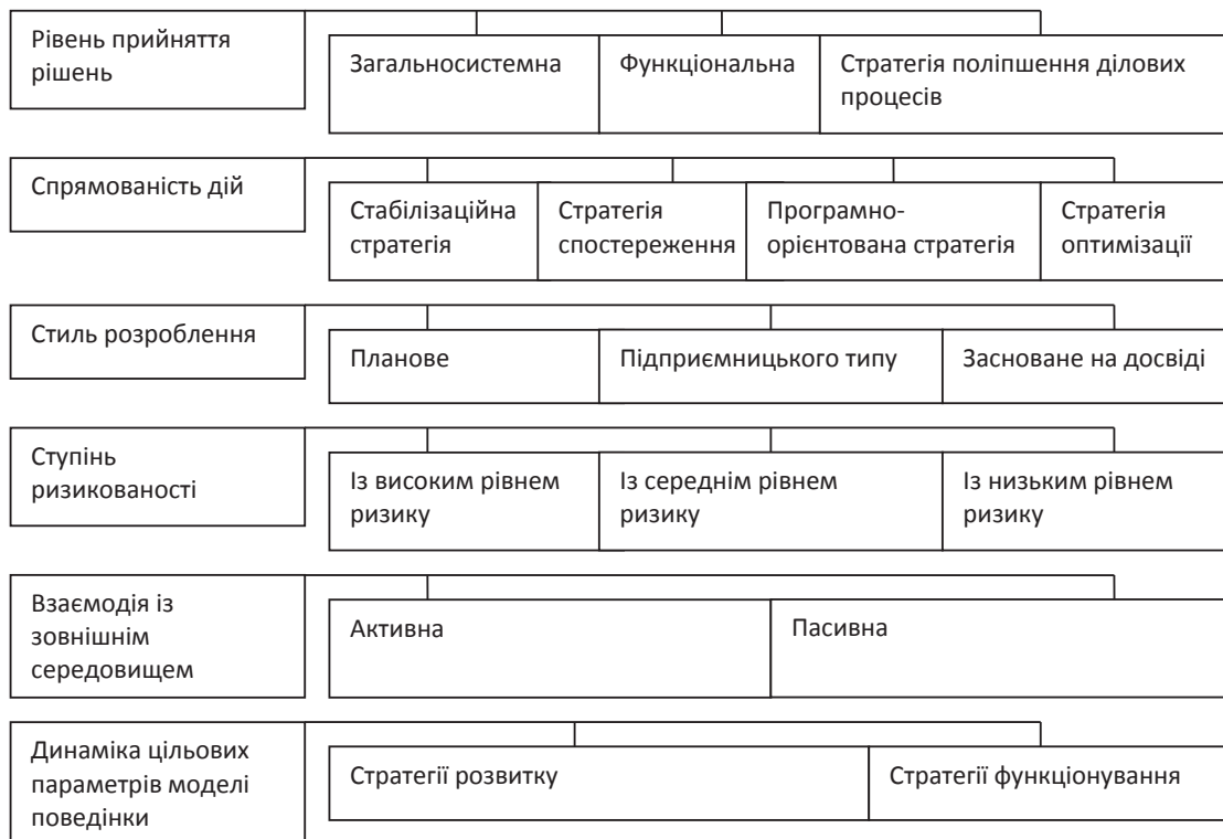
Рис. 1. Класифікація стратегій соціально-економічних систем [1–24]

Важливою характеристикою також є гнучкість елементів стратегії.