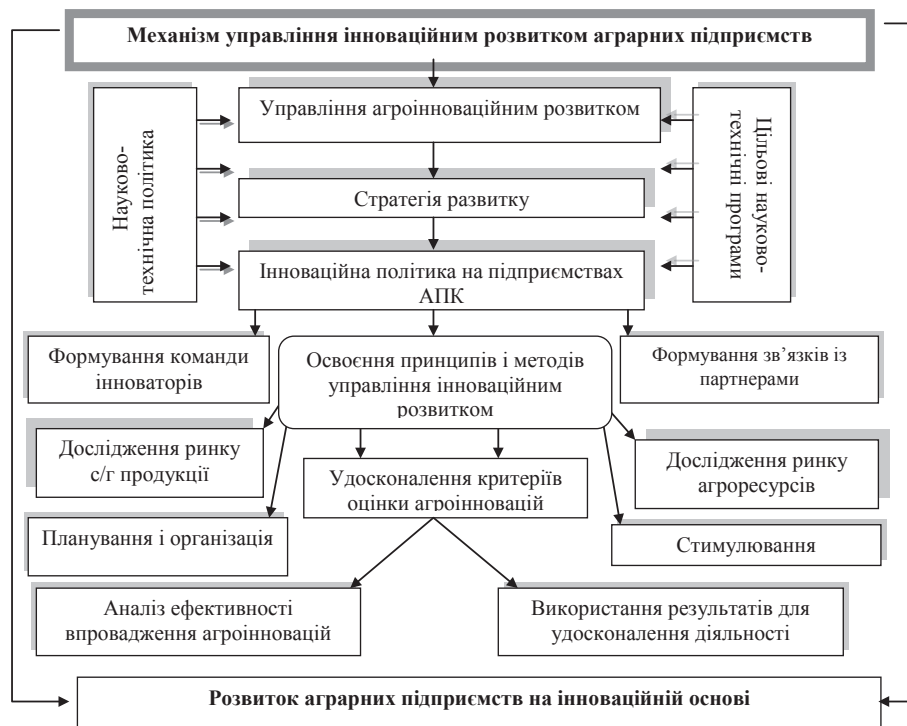
Рис. 1. Система регіонального регулювання агроінноваційних процесів*

В економіко-математичну модель було взято показники інноваційного розвитку галузі за 2016 р. по 238 сільськогосподарських організаціях регіону. Під час визна-