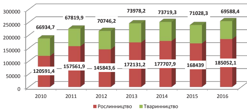
Рис. 2. Структура валової продукції сільського господарства України за 2010-2016 рр. [11]

Висновки. Результати проведеного дослідження свідчать, що джерелом