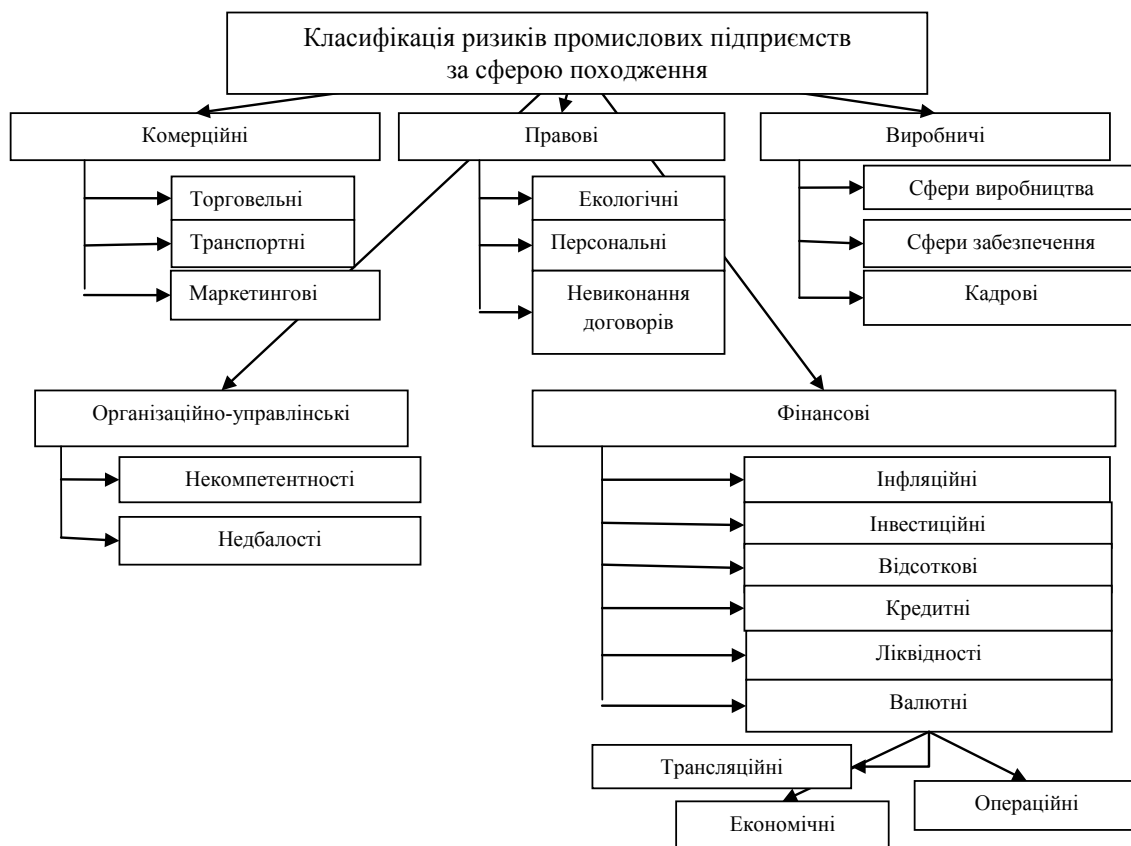
Рис. 2. Класифікація ризиків у діяльності промислових підприємств за сферою походження [3, с. 115–120]

електричних печей, а також має багато супровідної продукції. Сьогодні воно займає лідируючі місця серед конкурентів як в Україні, так і серед країн світового ринку завдяки якості та широкому асортименту продукції, що виробляється на підприємстві. Серед основних ризиків для ПрАТ «Український графіт» характерні: ринкові ризики, запобігати яким можна шляхом диверсифікації продукції, що виробляється, та поліпшення її якості; ризики нестабільної ситуації в країні, як політичної, так й економічної; зміна конкурентного середовища; зміна попиту в металургії; форс-мажорні ситуації на підприєм-