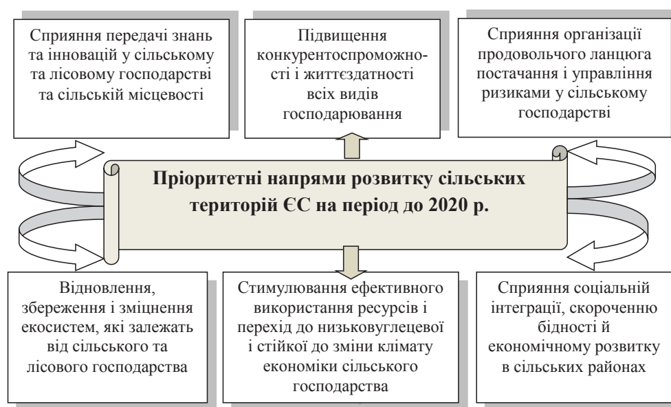
Рис. 3. Стратегічні напрями політики сільського розвитку ЄС у 2014–2020 рр.

Висновки. Узагальнення вищевказаного, свідчить про те, що трансформаційні перетворення, які відбувалися в Україні останні 30 років, справили значний вплив на розвиток українського села. Тому дієвий організаційно-економічний механізм реалізації стратегії сталого розвитку сільських територій має забезпечити: соціально-демографічну стабілізацію на селі; належний рівень економічно-виробничого розвитку; розвиток інститутів місцевого самоврядування; впровадження програм сталого сільського розвитку; інвестиційну привабливість сільської місцевості, а також формування такої соціальної інфраструктури села, яка би покращила умови праці і рівень життя на селі.