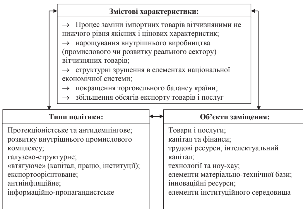
Рис. 1. Елементи сутнісної характеристики імпортозаміщення

Наслідки реалізації політики імпортозаміщення здебільшого позитивні та спрямовані на зростання вітчизняних базових видів економічної діяльності, збільшення