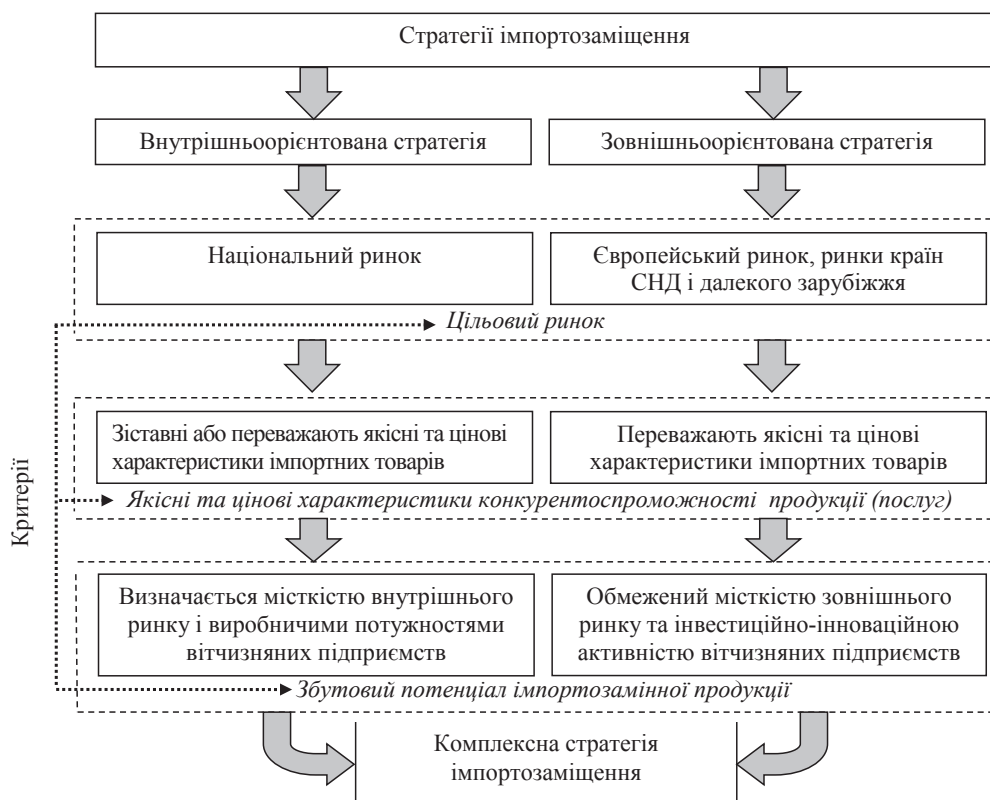
Рис. 2. Критеріальні параметри стратегій імпортозаміщення

обсягів ВВП, покращення зайнятості, підвищення економічної ефективності економічних агентів та рівня якості життя населення за допомогою імпортного протекціонізму, тарифних та нетарифних обмежень [3], реалізації політики стимулювання внутрішнього виробництва товарів, що у поточному періоді здебільшого імпортуватимуться [4], реалізації т. зв. імпортозамінної індустріалізації та заміни товарів, що імпортуються, на вітчизняні шляхом розвитку виробничих комплексів, здатних замінити зовнішнє постачання товарів.