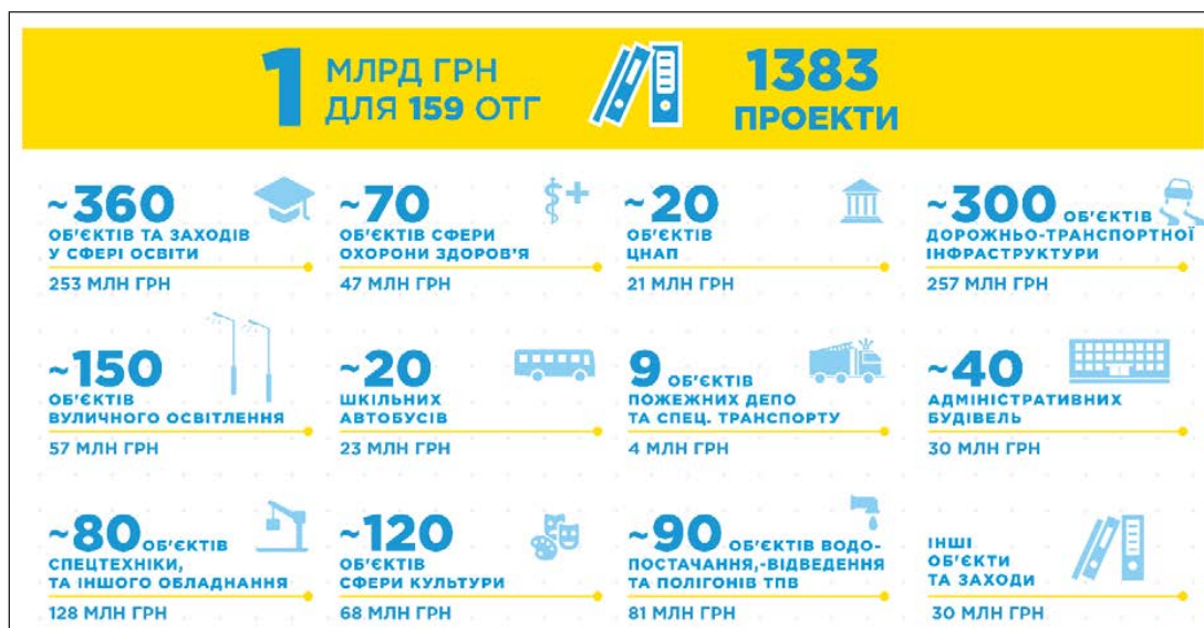
Рис. 3. Державна інфраструктурна субвенція об'єднаним громадам 2016 [10]

Ще одна досить серйозна та складна у вирішенні проблема, пов'язана з фінансовими ресурсами ОТГ, – це відсутність механізму розмежування бюджетів у зв'язку з формуванням ОТГ. Відповідно до чинного законодавства сьогодні відсутній механізм врегулювання питань перерозподілу районного бюджету у зв'язку з формуванням на його території ОТГ. Це приводить до того, що створені всередині поточного року об'єднані