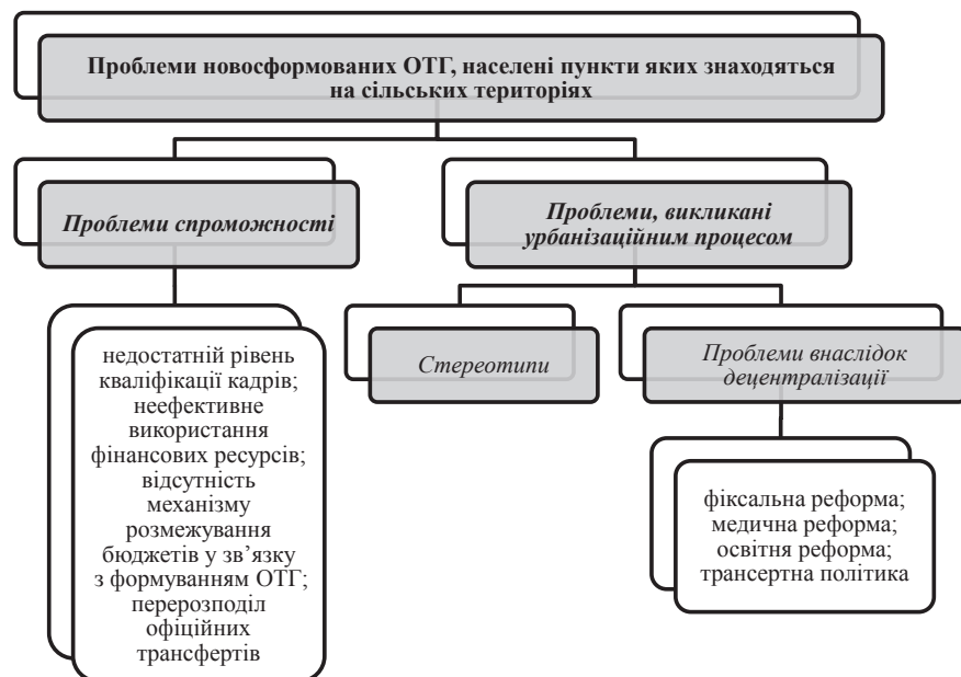
Рис. 2. Проблеми новосформованих ОТГ

Провівши аналіз всього комплексу проблем, з якими безпосередньо можуть зіштовхнутися населені пункти, що знаходяться на сільських територіях, можна виділити дві великі групи – проблеми спроможності та проблеми, викликані урбанізаційним процесом (рис. 2).