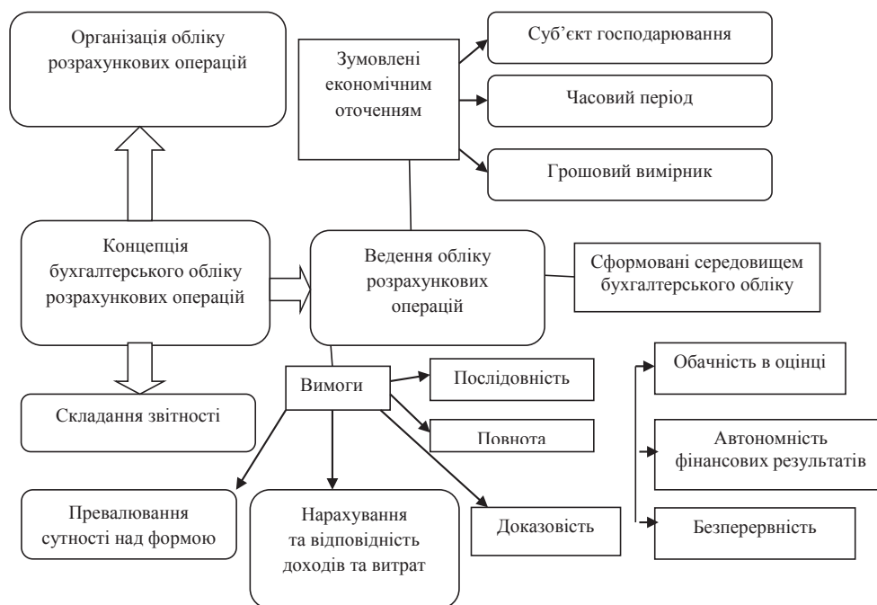
Рис. 3. Концепція бухгалтерського обліку розрахункових операцій

Доцільність виокремлення концепції бухгалтерського обліку розрахункових операцій зумовлена економічним оточенням та пояснюється тривимірністю навколишнього світу: будь-який об'єкт можна виміряти у просторі, часі та енергії. Тому факти господарського життя (ФГЖ) повинні стосуватися певного суб'єкта господарювання – ідентифікація у просторі; господарські операції відбуваються на певну дату, звітність складається за чітко визначений часовий проміжок (в умовах комп'ютеризації обліку це може бути не лише місяць, квартал або рік, а й день, декада, тиждень) – ідентифікація у часі; окрім того, усі ФГЖ повинні бути виміряні у грошовому вимірнику (з можливим уточненням характеристик із застосуванням натурального та трудового вимірників). Принципи, сформовані середовищем бухгалтерського обліку, є об'єктивними за своєю сутністю, тоді як вимоги є більш суб'єктивними, саме ця група принципів найбільше змінюється зі зміною умов господарювання.