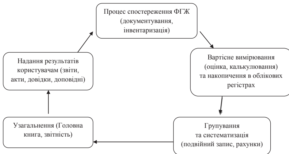
Рис. 2. Етапи формування інформації в системі бухгалтерського обліку

3) концепція незмінності ( consistency concept ) вимагає, щоб звітність за послідовні періоди часу велася на основі незмінності методів обліку;