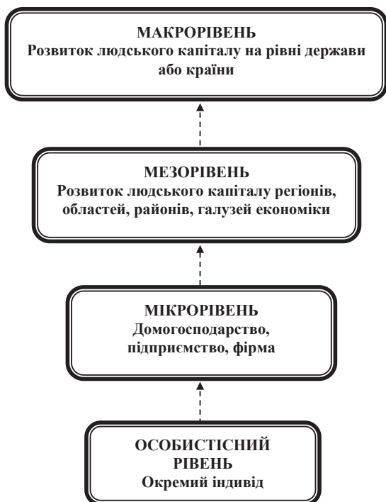
Рис. 3. Рівні інвестицій в людський капітал

ствам притаманний прагматичний підхід: вони здійснюють інвестиції в людський капітал лише тоді, коли вони приносять економічну віддачу. Інвестуючи у своїх працівників, підприємства активізують їхню трудову віддачу, підвищують продуктивність праці, скорочують витрати робочого