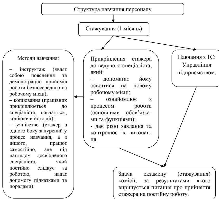
Рис. 1. Структура первинного навчання персоналу на ПрАТ «УКпостач»

Після проведення тендеру керівництво виставляє оцінки та визначає подальше місце працівника (підвищення, переведення на іншу посаду, звільнення).