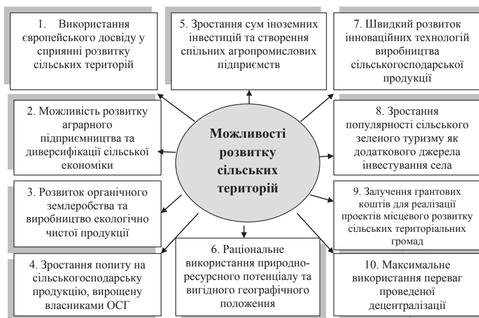
Рис. 3. Потенційні можливості (Opportunities), які сприятливі для розвитку сільських територій Західного Полісся