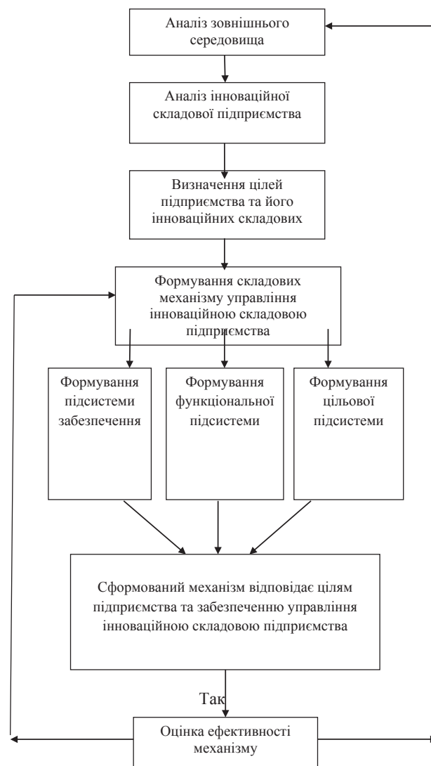
Рис. 1. Послідовність формування механізму організаційно-економічного забезпечення управління інноваційною складовою підприємства

По-друге, механізм організаційно-економічного забезпечення управління інноваційною складовою підприємства містить також систему забезпечення, підсистеми забезпечення та складові, а саме функціональну та цільову. Механізм пропонується формувати за послідовністю, яка зображена на рис. 1.