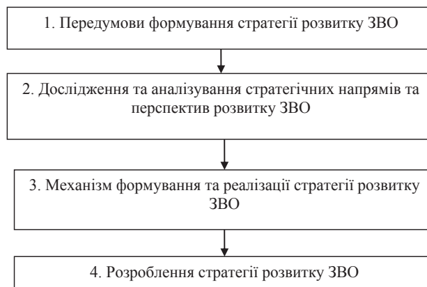
Рис. 2. Загальні етапи процесу формування стратегії ЗВО

З метою розкриття змісту, визначення основних структурних елементів стратегічного розвитку ЗВО пропонуємо такі загальні етапи процесу формування стратегії розвитку освітніх установ, що відображені на рис. 2.