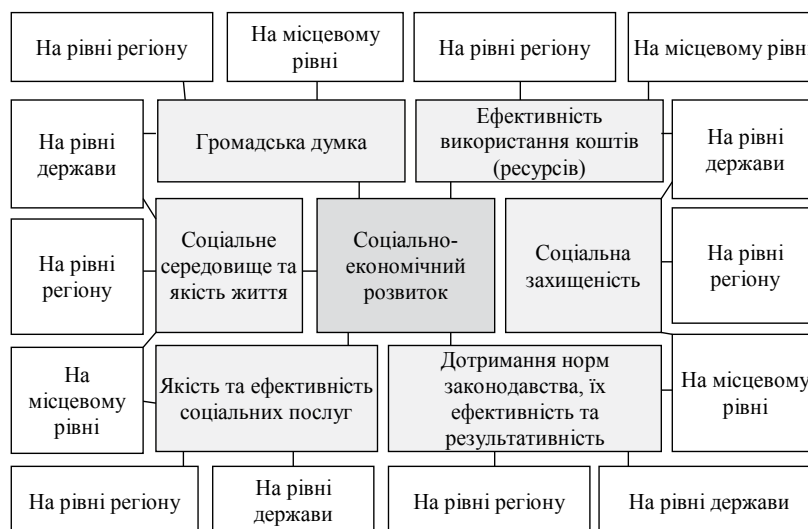
Рис. 1. Система об'єктів, що повинні підлягати контролю в механізмах формування та реалізації соціальної політики держави

Таким чином, моніторинг є не настільки деталізованим та глибоким, як оцінювання та діагностика, однак він дає змогу здійснювати порівняння фактично вжитих заходів, отриманих результатів з тими, що заплановані. Іншими словами, здійснення контролю у формі моніторингу дає змогу виявляти проблемні місця вже на етапі розроблення програм, заходів, проектів, стратегій соціально-економічного розвитку тощо. Окрім того, застосування моніторингу дає змогу отримувати оперативні результати щодо прийняття чи неприйняття громадськістю тих чи інших