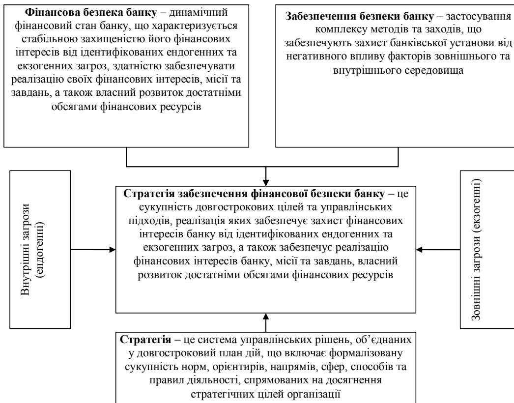
Рис. 1. Теоретичний інструментарій формування поняття «стратегія забезпечення фінансової безпеки банку»

Загалом будь-яка стратегія є елементом механізму організації, стратегія забезпечення фінансової безпеки банку є складовою його фінансового механізму. Стратегія забезпечення фінансової безпеки банку будується на основі концепції його розвитку, що має містити пріоритетні цілі та завдання забезпечення безпеки, шляхи