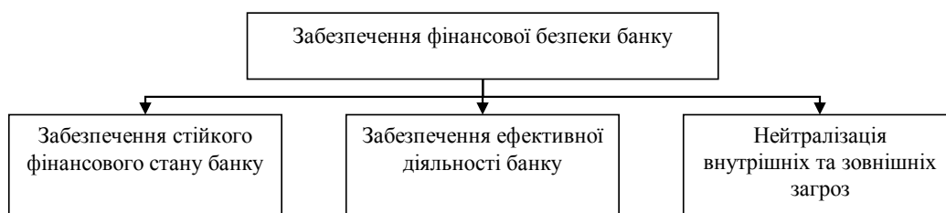
Рис. 3. «Дерево цілей» стратегії забезпечення фінансової безпеки банку