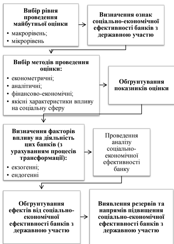
Рис. 1. Алгоритм проведення оцінки соціально-економічної ефективності банків із державною участю за умов трансформації

З метою систематизації процесу проведення оцінки соціально-економічної ефективності банку з державною участю за умов трансформації наведемо її у вигляді певного алгоритму проведення оцінки (рис. 1).