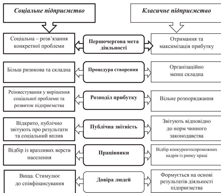
Рис. 1. Окремі характеристики соціального та класичного підприємства

Соціальне підприємництво поєднує у собі не тільки економічну та соціальну компоненти, значна увага приділяється екологічній, психологічній, моральній, етичній, а також питанням соціальної справедливості (див. рис. 2).