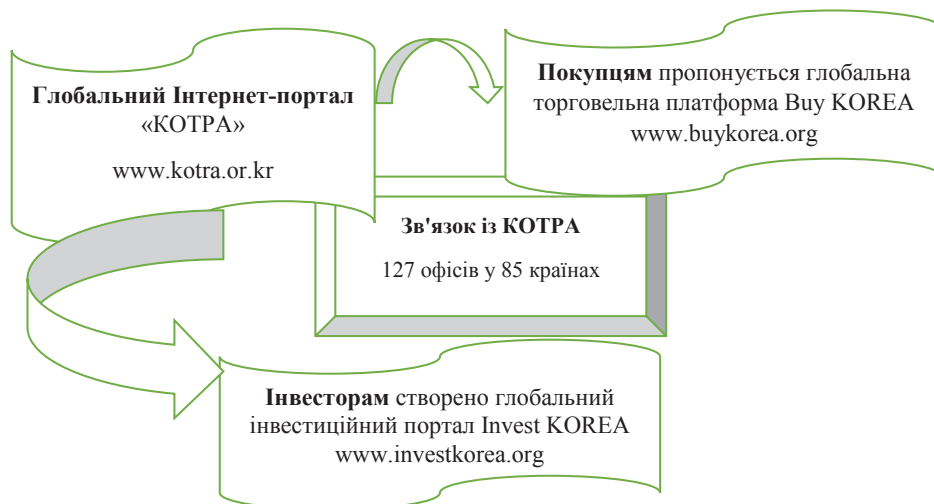
Рис. 1. Глобальна мережа офісів компанії «КОТРА». Основні Інтернет-платформи для співробітництва з корейськими компаніями

Своєю чергою, Інтернет-платформа Invest Korea (далі – ІК) є стратегічним підрозділом компанії KOTRA щодо залучення глобальних інвестицій у південнокорейську економіку (рис. 3).