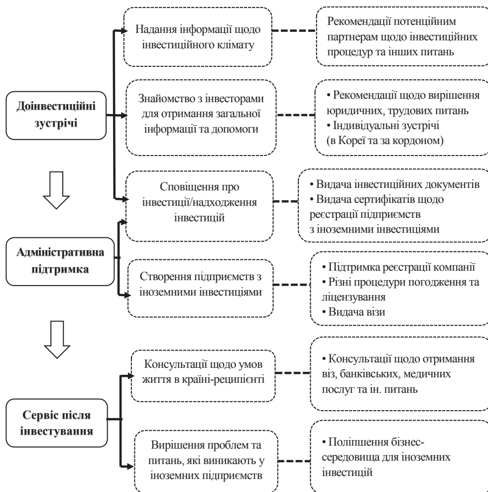
Рис. 3. Модель функціонування платформи ІК [8]