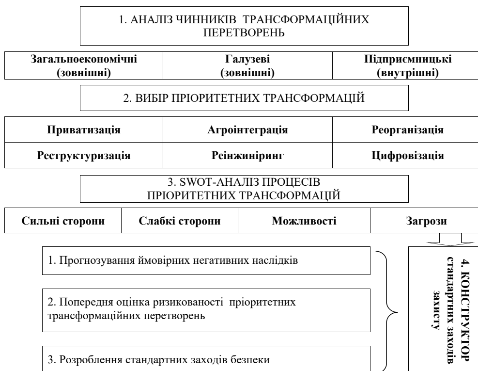
Рис. 1. Модель механізму конструювання стандартних заходів безпеки від загроз пріоритетних трансформацій у системі економічної безпеки підприємства