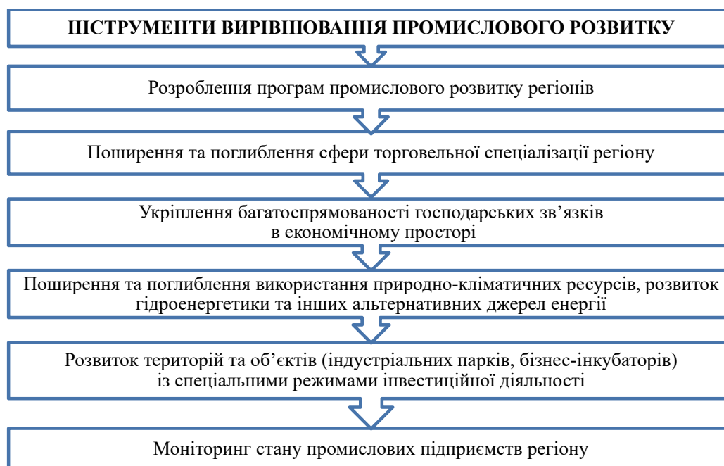
Рис. 3. Інструменти вирівнювання розвитку промисловості регіонів