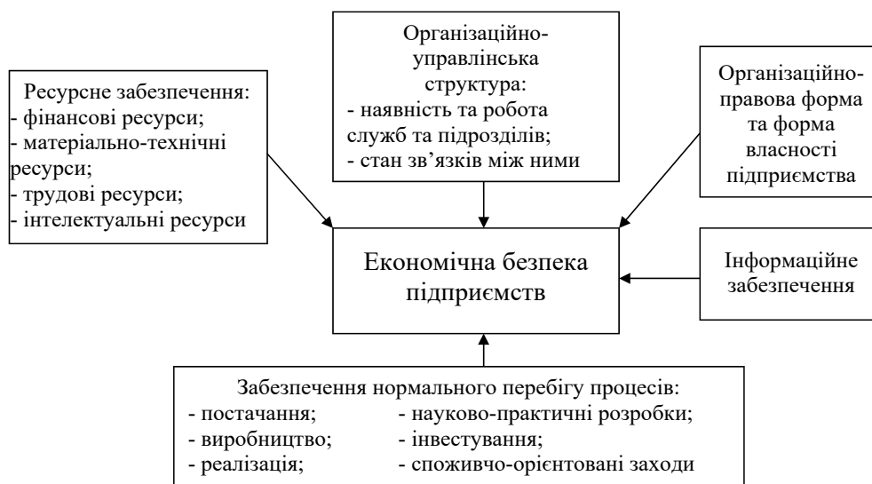
Рис. 2. Внутрішні чинники економічної безпеки підприємства

Г.М. Головінова серед чинників, які негативно впливають на економічну безпеку, виділяє: неефективність державного регулювання економічних процесів; поспішну і