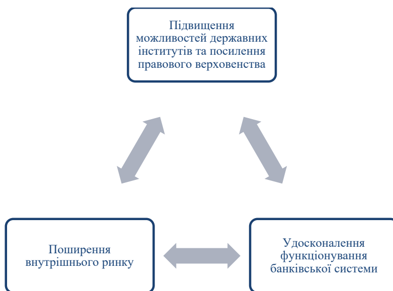
Рис. 4. Основні напрями активізації інвестиційної діяльності та підвищення рівня інвестиційної привабливості економіки України