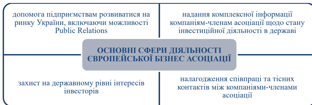
Рис. 1. Основні сфери діяльності Європейської Бізнес Асоціації

Таким чином, є очевидним той факт, що оцінка економіки України у світових рейтингових агентствах узагальнює картину щодо стану інвестиційного середовища та рівня інвестиційної привабливості держави. Аналіз рейтингових позицій економічного розвитку України в міжнародних дослідженнях показує, що на жаль, позиції нашої держави протягом тривалого часу залишаються досить низькими та слабкими.