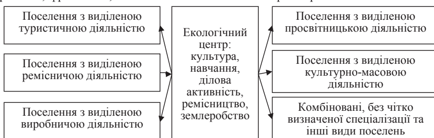
Рис. 1. Схема формування агроєкомістечка

Таким яскраво вираженим українським екологічним родовим поселенням є «Простір Любові», яке розташоване в Новоград-Волинському районі Житомирської області на мальовничих берегах річок Тетяни та Теньки,