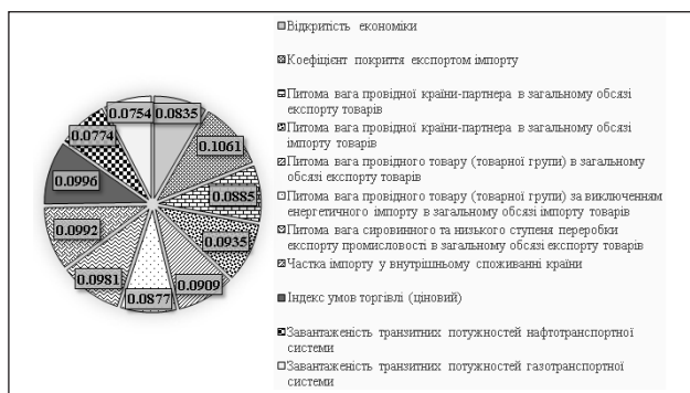
Рис. 2. Вагові коефіцієнти складових інтегрального показника зовнішньоекономічної безпеки України