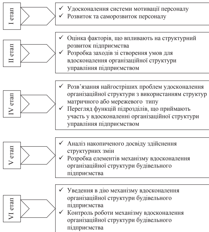
Рис. 2. Основні етапи удосконалення організаційної структури на підприємстві