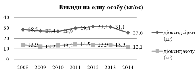
Рис. 1. Викиди діоксиду сірки та оксиду азоту на одну особу [2]

Важливою проблемою на даному етапі світового розвитку є забруднення атмосферного повітря викидами які потрапляють в атмосферу: пил, сірка, свинець, вуглець та інші речовини, небезпечні для людського організму. Вони несприятливо впливають на кругообіг багатьох компонентів на землі. Забруднюючі та отруйні речовини переносяться на великі відстані, потрапляють з опадами в ґрунт, поверхневі та підземні води, в океани, отруюють навколишнє середовище, негативно позначаються на прирості рослинної маси.