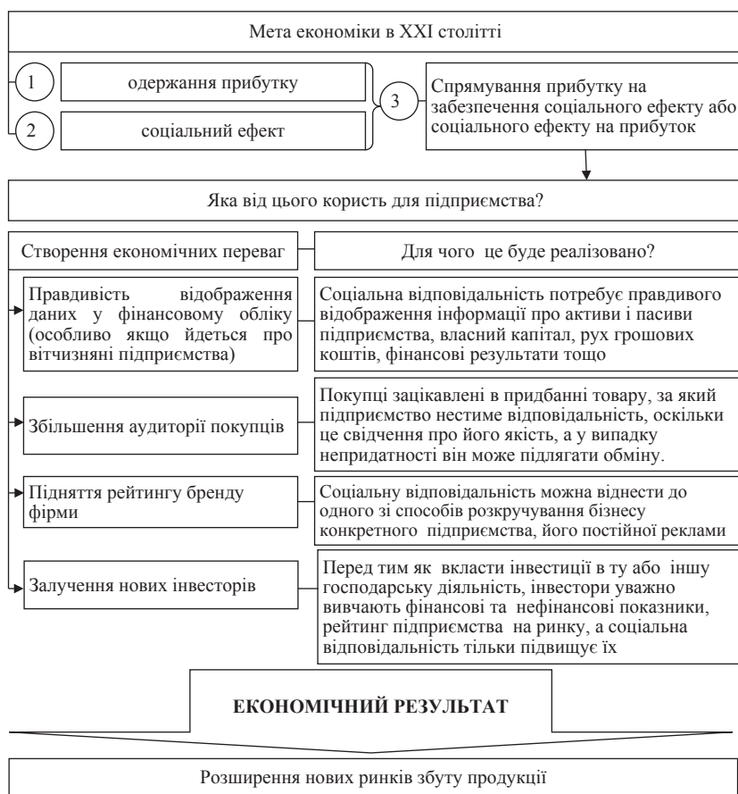
Рис. 1. Основні переваги від упровадження соціальної відповідальності