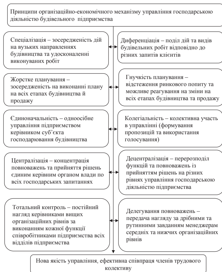
Рис. 2. Принципи організаційно-економічного механізму управління маркетинговою діяльністю будівельного підприємства

Як показано на рис. 3, організаційні складові включають нормування, регламентування, інструктування, розподіл функцій, побудову організаційної структури і т. ін. Економічні складові методів організаційно-економічного механізму управління підприємств можна поділити за сферою впливу на дві підгрупи, тобто на внутрішні (розрахунок рентабельності, прибутковості, планування економічних показників діяльності) та зовнішні (ціноутворення, кредитування, фінансування, страху-