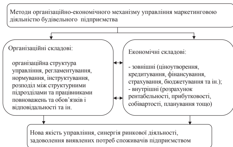
Рис. 3. Базові складові методів організаційно-економічного механізму управління маркетинговою діяльністю будівельного підприємства

вання, бюджетування та ін.). Базові складові методів організаційно-економічного механізму управління необхідні для ефективної організації та функціонування будівельних підприємств та їх подальшого розвитку. Злагоджена робота елементів забезпечується процедурами організаційно-економічного механізму управління маркетинговою діяльністю суб'єкта господарювання сфери будівництва.