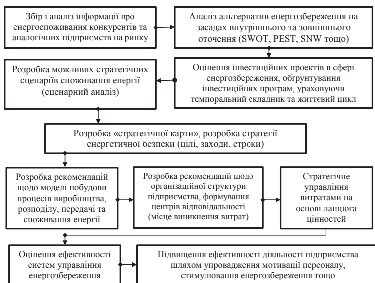
Рис. 1. Етапи побудови системи управління енергозбереження суб'єкта господарювання