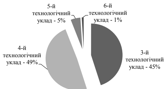
Рис. 1. Технологічна структура промислового виробництва України [4, с. 11]

Упродовж багатьох років особливістю промисловості України є її технологічна різноукладність у домінуванні нижчих за рівнем технологічних укладів (3-го та 4-го), наявність різних техноекономічних секторів і галузевих сегментів з різною конкурентоспроможністю, а також ринкових секторів з різними рівнями споживання (див. рис. 1).