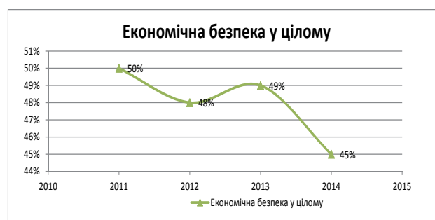
Рис. 1. Динаміка інтегрального показника рівня економічної безпеки України за 2011–2014 рр., %

Як бачимо з рисунку 1, при оптимальному значенні інтегрального показника 100%, найвищий рівень інтегрального показника спостерігався у 2011 р. – 50%, що характеризується, як небезпечний рівень економічної безпеки (діапазон 40–59%). При цьому, протягом всього аналізованого періоду рівень економічної безпеки знаходився в межах інтервалу 40–59%, не виходячи за межі небезпечної зони та не досягаючи задовільного рівня, що слід оцінювати негативно. Негативною тенденцією також є зменшення інтегрального показника на кінець 2014 р. на 4% в. п. або на 8,9% порівняно зі станом на кінець 2013 р.