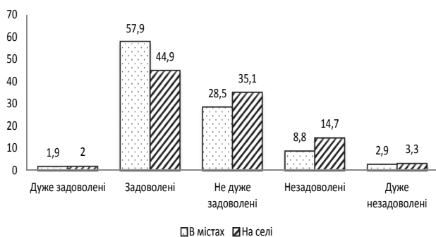
Рис. 3. Розподіл міських та сільських домогосподарств за ступенем задоволення своїми житловими умовами у 2015 р. [10]

За підсумками опитування 56% домогосподарств задоволені у цілому або дуже задоволені своїми житловими умовами, що на 2 в. п. більше, ніж у минулому році. У великих містах такі оцінки повідомили 62% домогосподарств (у 2014 р. – 61%), у малих – 57% (54%), на селі – 47% (44%) [10].