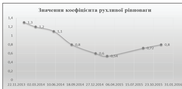
Рис. 3. Траєкторія адаптації «Согум Груп» у 2014–2015 рр.

Висновки. Таким чином, у дослідженні подано організаційну структуру управління ВГС у машинобудуванні та особливості взаємодії підприємств, що входять до складу даного виду ВГС. На прикладі машинобудівного холдингу «Согум Груп» встановлено особливості функціонування ВГС у сучасних умовах.